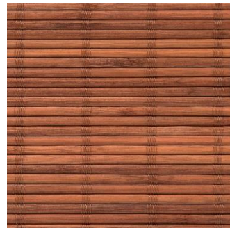
生地番号466 材質：天然竹

チェーン式ローマンシェード「KC かすみ」(防災品) 製作例： W900×H1300 mm 本体価格 ¥35,000(税別・工事費別)