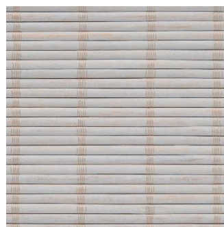
生地番号465 材質：天然竹

チェーン式ロールスクリーン「CRS かれん」（防災品） 製作例：W1200×H1200 mm 本体価格 ¥42,200（税別・工事費別）